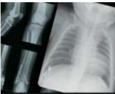
Elevada resolución de 508 ppp