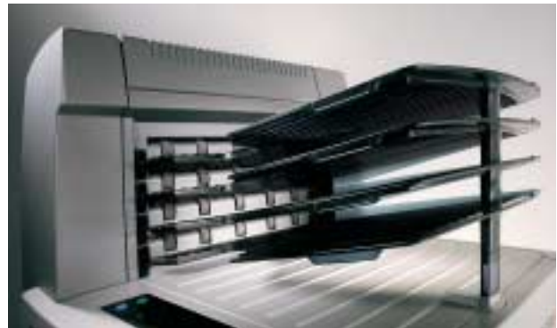
El clasificador exclusivo elimina los atascos