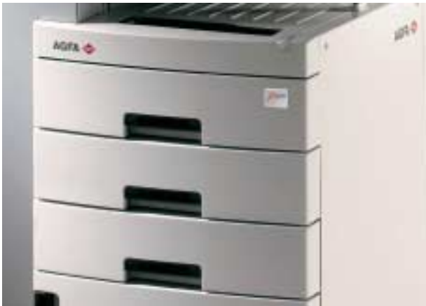
Tres bandejas de película para varios formatos en línea

Y lo que la DRYSTAR 5503 gana en versatilidad, el usuario lo recibirá en comodidad y ahorro de tiempo.